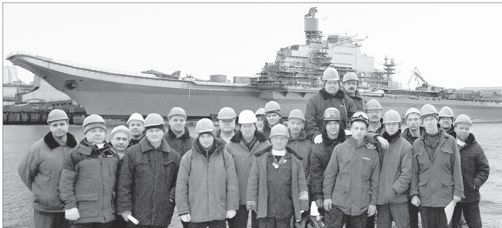
Отличились сборщики третьего участка цеха 40

Системами вентиляции и кондиционирования воздуха на переоборудуемом авианосце «Викрамадитья» занимаются сборщики-достройщики цеха 40. Они, образно выражаясь, вдыхают в корабль жизнь. В последние месяцы вентиляционщики достигли заметных успехов в выполнении производственных заданий, стали хорошим примером для других коллективов.